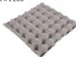
Réf.: NUNI+ grau

Abmessungen der verlorenen Paletten: 1 000 x 1 200