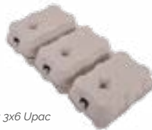
Réf.: 3x6 Upac