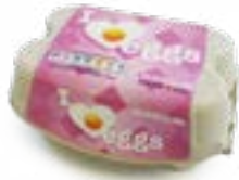
Réf.: 2x6 ComPac®