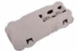
Réf.: 10 TopView®