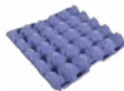
Réf.: 25 LBS blau