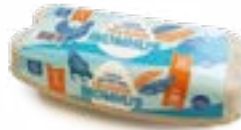
Réf.: 10 ComPac®