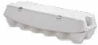
Réf.: 12 ComPac®