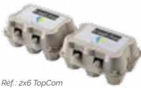
Réf.: 2x6 TopCom