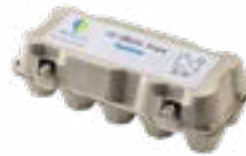
Réf.: 10 TopCom