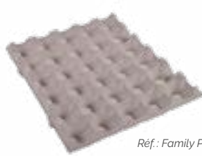
Ref.: Family Pack 30 grau