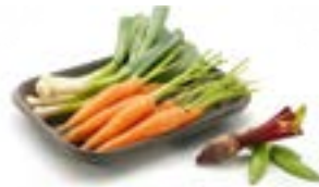
Ref.: Fruitl 1