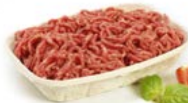
Ref.: OP 11 K