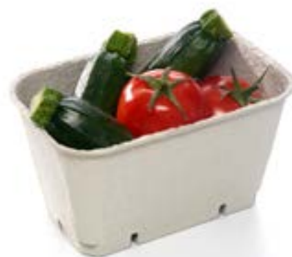
Ref.: MP 37