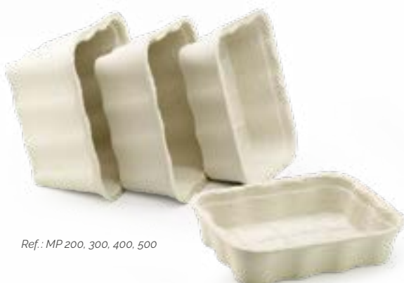
Ref.: MP 200, 300, 400, 500