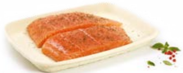
Ref.: OP 4 SK

ZUM VERPACKEN UNSERER NAHRUNG UND DEM ERHALT DER ERDE Entdecken Sie alle unsere Lösungen unter omnipacgroup.com