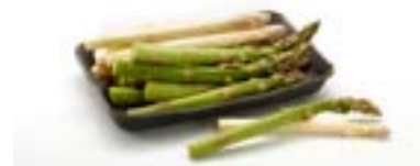
Ref.: Fruitl 6M