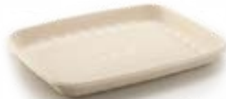
Ref.: OP 3 SK